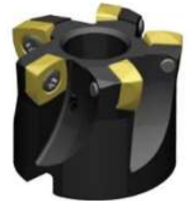
7792VX 09 7792VX 12