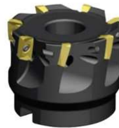
Mill1 10 Mill1 14